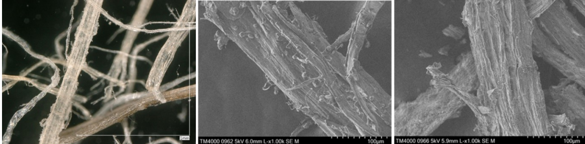
Abbildung 2: Fasermaterial der Slab Mischung (Hanf-Miscanthus 5/0), im Gewächshaus mit Tomate (Rinnenkultur) im Praxisbetrieb. Links: Digitalmikroskop vor Vergleichsbeginn mit durchgehender Wachsumhüllung. Mitte: SEM-Aufnahme vor Vergleichsbeginn mit glatter, intakter Oberfläche. Rechts: SEM nach elfmonatiger Kultur mit Aufrauung, beginnender Auffaserung und Mikrofrakturen als Hinweis auf strukturellen Abbau der Fasern.

deren Einsatz in langstehenden Kulturen sein könnte. Weitere Untersuchungen zur Optimierung der Faserbehandlung, etwa durch gezielte Beschichtungen oder Kombination mit stabilisierenden Komponenten, erscheinen notwendig, um die strukturelle Integrität über die gesamte Kulturdauer sicherzustellen.